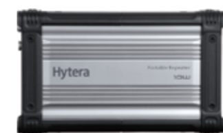
Repetidor portátil RD966

Para conocer más acerca de Hytera Dispatch System y el repetidor portátil, visite www.hyterala.com o comuníquese con sus distribuidores y representantes de ventas locales.